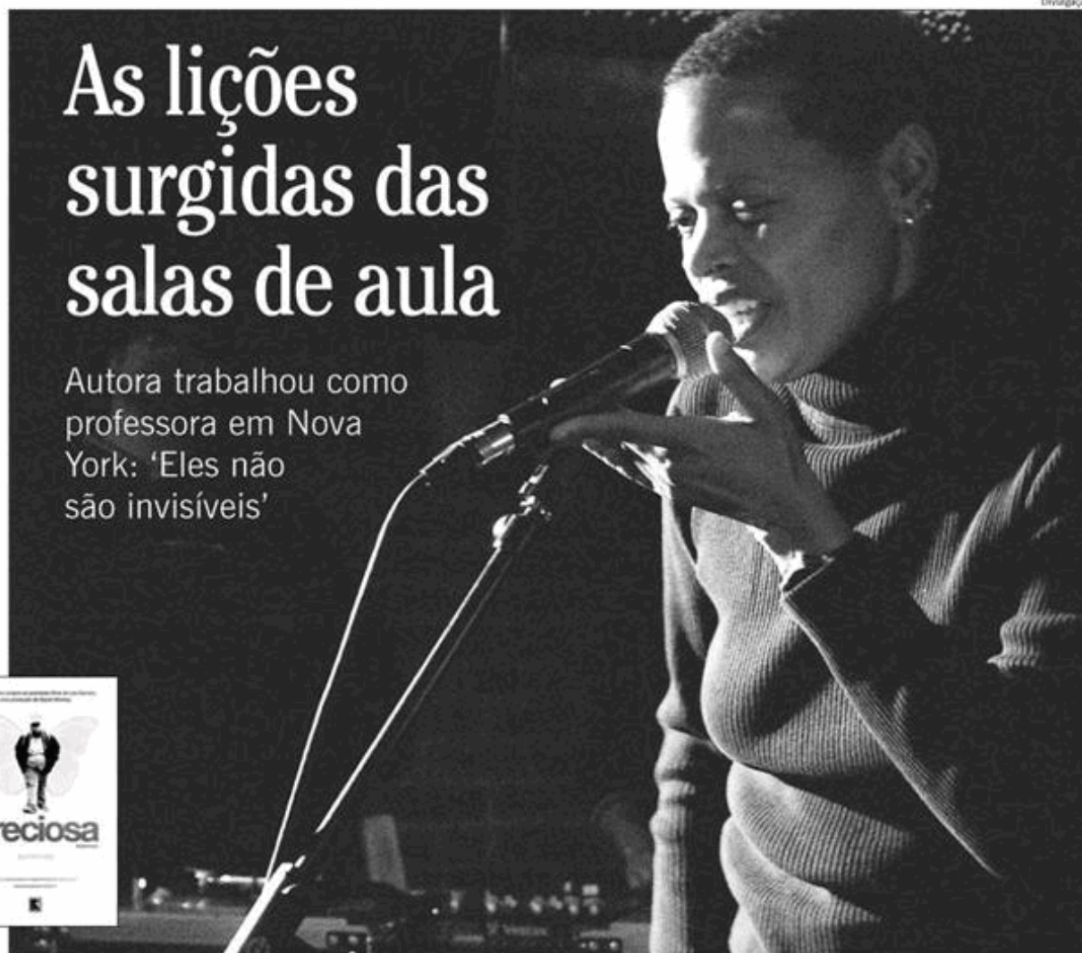
DEPOIS DO sucesso do filme baseado em seu livro, Sapphire pretende lançar um novo romance, seu segundo, sobre um jovem negro que trabalha no mercado de arte de Nova York

Sapphire escreveu "Preciosa" a partir de sua experiência como professora de retórica em escolas do Harlem e do Bronx. Mas não houve uma aluna apenas que deu origem à protagonista Precious: foram várias. Dessa maneira também foi elaborado o perfil da Srta. Rain, a professora que dá autoestima e ensina Precious a escrever. A personagem, lésbica e bondosa, é vista como um alter-ego da própria Sapphire. Mas a autora rejeita a comparação.